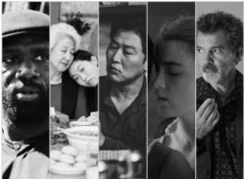
金球奖最佳外语片提名:《悲惨世界》、《别告诉她》、《寄生虫》、《燃烧的女子肖像》和《痛苦与荣耀》

第77届金球奖的提名名单,近日已经公布。业内认为金球奖今年对奥斯卡的影响会比往年更大。