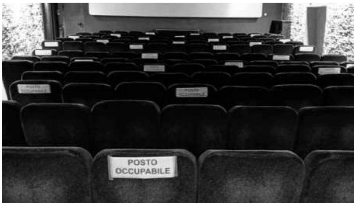
比萨的阿森纳电影院——标签上写着“可以坐的位置”

5)鉴于电影节对于宣传和销售电影以及在所有参与其中的电影制片人的职业发展中具有重要意义,因此至关重要的是,电影制片人必须获得与导演同等出席电影节首映礼的待遇,特别是要改变目前作为有酬的执行制片人通常会自己付费参加的现状。因此,我们鼓励销售代理商确保制片人始终与导演联系在一起,以参加该电影的任何国际和英国首映,包括报销其旅行、住宿和电影节认证的费用。我们希望融资公司也在财务上支持这一举措。