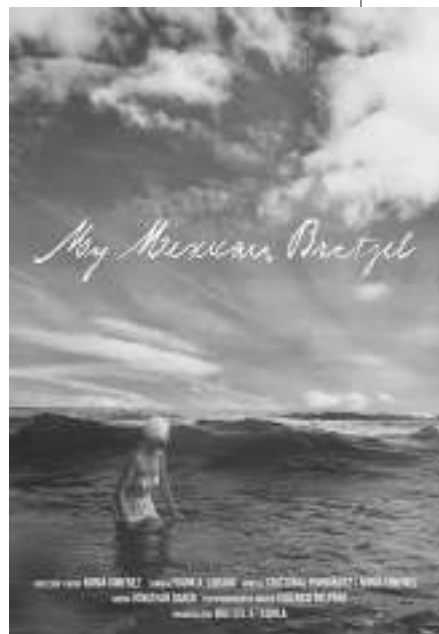
《我的墨西哥椒盐脆饼》