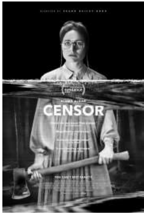
投入了大量宣传的《电影审查员》