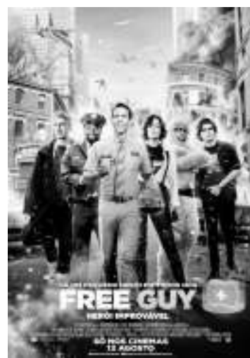
2090万美元,超过了国际累计票房总额的一半。

第二名是派拉蒙公司的《汪汪队立大功大电影》,新增周末票房1030万美元,迄今为止,来自46个市场的国际累计票房已达3780万美元,全球累计票房已达6190万美元。在新上映的地区中,俄罗斯/独联体以77万美元领先;其次是西班牙的59万美元和丹麦的46万美元。在续映地区中,德国的表现最好,新增票房210万美元,较上上个周末的跌幅为11%;法国新增票房130万美元;英国/爱尔兰新增票房80万美元。英国/爱尔兰当地累计票房已达790万美元;法国当地累计票房已达690万美元;德国当地累计票房已达610万美元——合计为