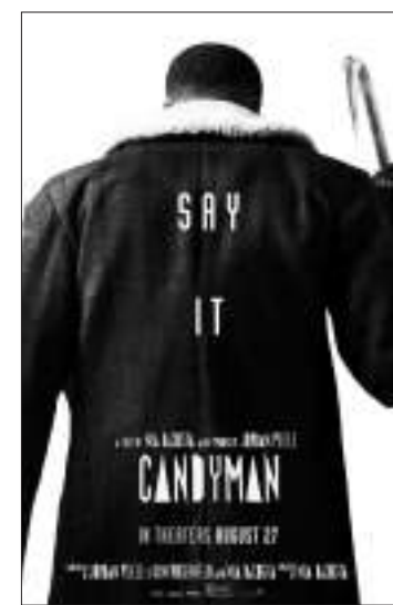
家影院中上映,平均单厅收入为3440美元,其北美累计票房已达7930万美元,其全球累计票房已达1亿7960万美元。

亚军是瑞恩·雷诺兹执导的《失控玩家》,这部来自20世纪电影公司和迪士尼公司的喜剧影片第三周的北美影院票房收入刚刚超过1350万美元。与《糖果人》一样,这也是一部仅限影院上映的影片,较上上个周末的跌幅仅为26.7%。这部PG-13级电影,上周末在北美的3940