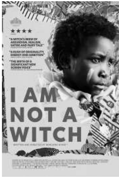
伦敦加诺·尼奥尼2017年的处女作《我不是女巫》获得了众多好评,但她还没有拍第二部电影。