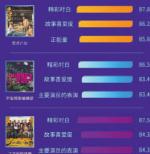
三部影片普通观众细分维度得分TOP3

在专业观众细分评价中,《忠犬八公》的传播方式、情绪情感感染力、健康积极的价值观念为得分TOP3,同时也均为三部影片的最高分;另外,《宇宙探索编辑部》的创新新颖度、主要演员的表演和类型创作得分为三部影片中最高。