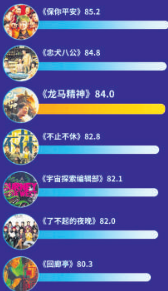
近一月主调查七部影片满意度对比

《龙马精神》融入成龙人生经历，向“龙虎武师”（武行）致敬，影片思想性得分84.8分，为三大指数中最高；值得一提的是，影片再现成龙式喜剧动作场景，“老罗”与“赤兔”的互动也颇有看点，影片新鲜度83.9分，为近一个月调查七部影片的第一位。