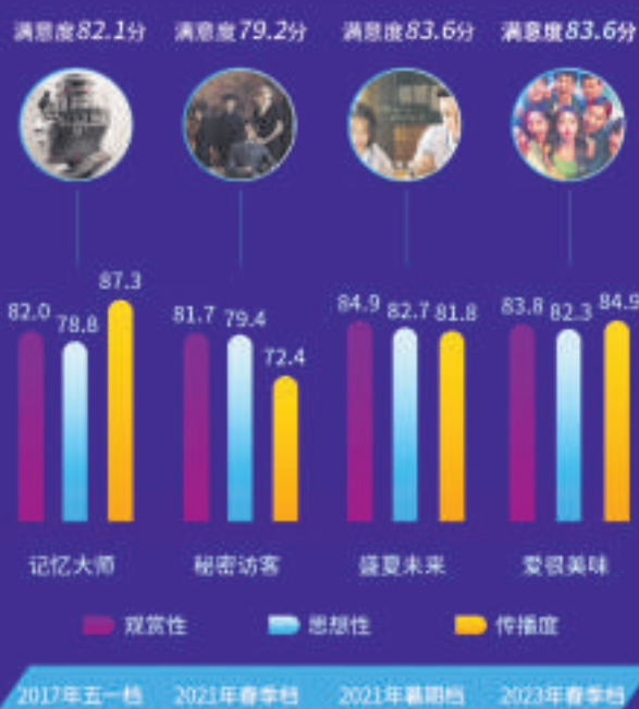
历史调查陈正道导演电影作品满意度及三大指数对比

• 与陈正道导演近年的其他作品相比，《爱很美味》的三大指数综合表现较为均衡，得分均超82分，单片满意度与2021年暑期档的《盛夏未来》基本相当，比2021年春季档的《秘密访客》高出4.4分。