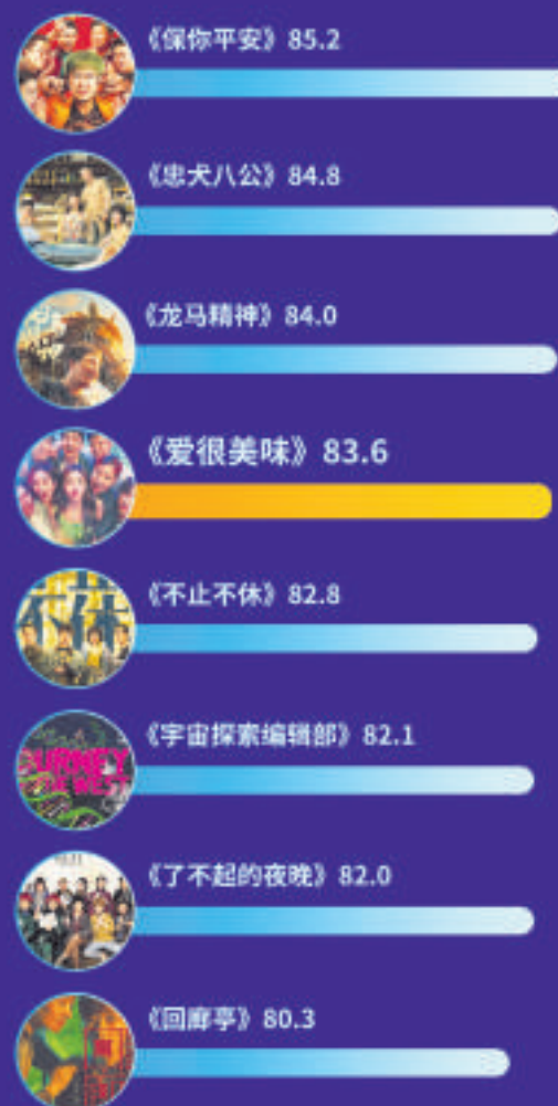
2023年3-4月主调查八部影片满意度对比

《爱很美味》以轻喜剧、反套路的方式描摹普通女性的真实生活及情感现状，给观众带来清新治愈的观影感受，满意度三大指数中以传播度得分最高，为84.9分，居3-4月主调查八部影片的第三位；同时，影片新鲜度也表现亮眼，得分83.9分，居八部影片的第二位。