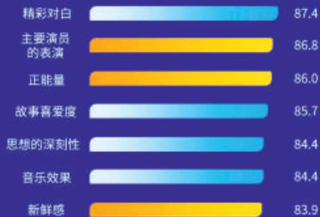
《龙马精神》普通观众细分维度得分TOP7

• 《龙马精神》更受普通观众喜爱，普通观众的满意度评分达84.4分，居近一个月调查七部影片的第三位。细分维度评价中，主要演员的表演、正能量、新鲜感居于近一个月调查七部影片的第一位，故事喜爱度、视觉效果、音乐效果等五项指标均居前三。