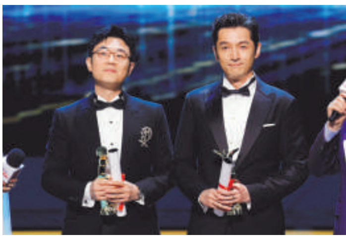
大鹏、胡歌获得最佳男演员奖