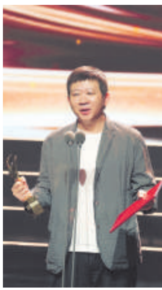
饶晓志凭《万里归途》获最佳导演奖