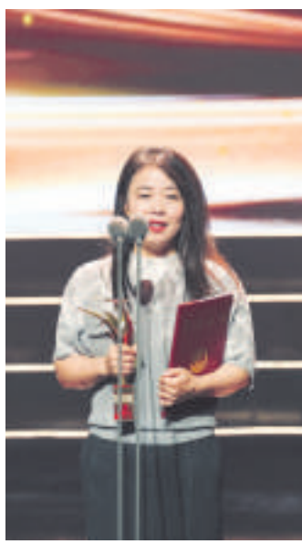
《流浪地球2》获最佳影片奖

第十八届中国长春电影节由中央广播电视总台、吉林省政府共同主办，长春市政府承办。中