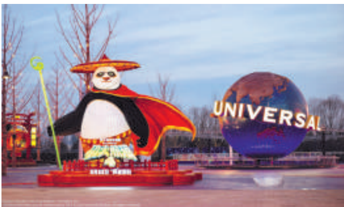
北京环球城市大道尽头功夫熊猫阿宝巨型花灯

即将于2024年3月22日全国上映的电影《功夫熊猫4》唤醒“IP回忆杀”,游客既可以在北京环球城市大道尽头打卡全新的功夫熊猫阿宝巨型花灯,也可以前往环球影城首个功夫熊猫盖世之地景区,重温英雄节的传说,感受经典大片世界的无尽魅力。届时,影迷们更可以第一时间在园区入手包括电影全新角色——小真在内的周边商品,将电影同款带回家。(影子)