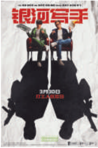
本报讯 近日,喜剧电影《银河写手》发布“又是周一”打工特别视频、“乙气‘疯’发”版海报,以真