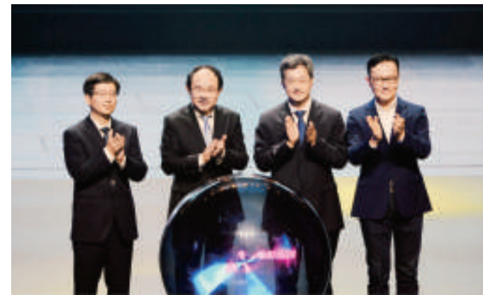
2024年全国电影惠民消费季正式启动

本报讯 为贯彻落实党的二十大精神,更好激发广大观众电影消费热情,促进电影市场繁荣,国家电影局于8月2日晚在四川省成都市举办2024年全国电影惠民消费季启动仪式。