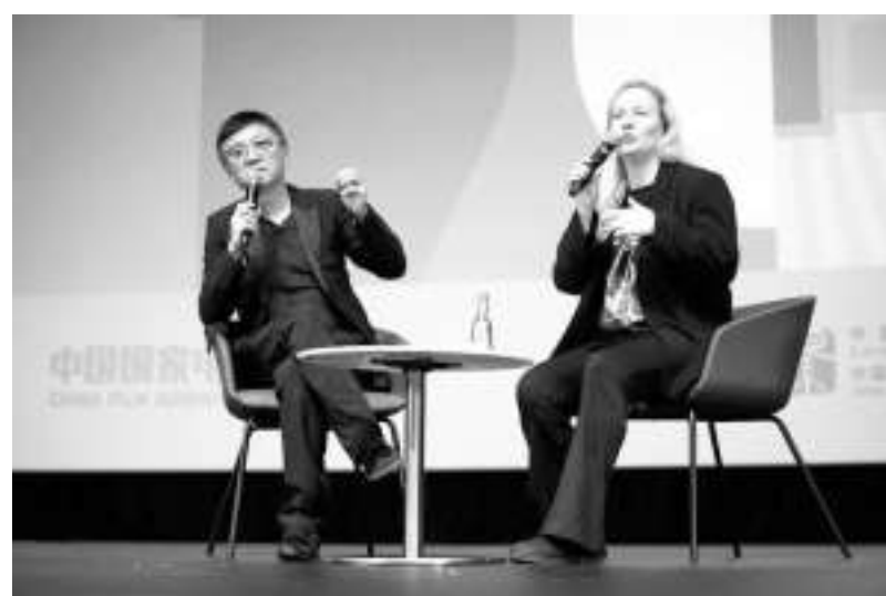
挪威、保加利亚、加拿大、塞舌尔、斯洛伐克、新加坡、马来西亚、菲律宾、阿联酋、克罗地亚、密克罗尼西亚联邦等地,通过优秀中国影片的展映,让海外观众深入

了解了中国的社会风貌、人文精神和时代变迁,为中外文化领域的深度合作注入了新的动力。