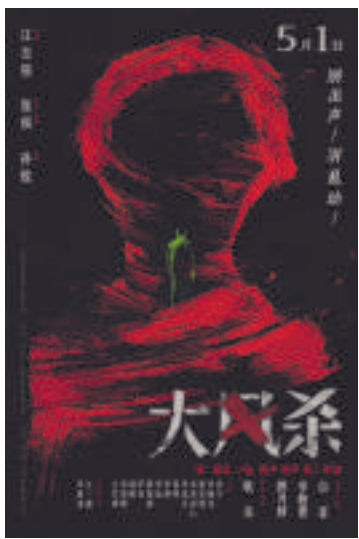
本报讯 电影《大风杀》宣布5月1日全国上映,该片由江志强监制,张琪