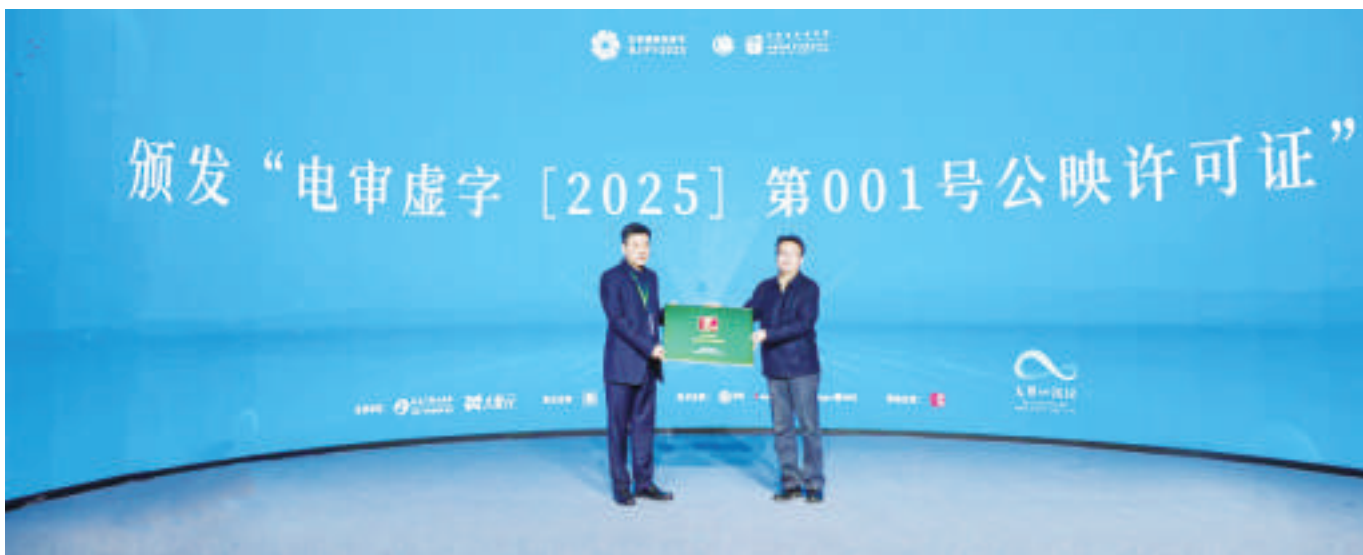
陆亮(右)为王仁海颁发“电审虚字〔2025〕第001号公映许可证”片头

4月17日,第十五届北京国际电影节“无界∞沉浸单元”举行开幕系列活动。中宣部电影局副局长陆亮,中国电影资料馆馆长、中国电影艺术研究中心主任孙向辉,中国电影科研所(中宣部电影技术质量检测所)党委书记、所长龚波,国家电影专资办主任杨武军,华夏电影发行有限责任公司党委书记、董事长白轶民,中国电影资料馆副馆长、中国电影艺术研究中心副主任林思玮,中宣部电影卫星频道节目制作中心副主任唐科,中影集团党委委员、中影股份副总经理任月,浙江省委宣传部副部长、省电影局局长范庆瑜,贵阳市市委常委、宣传部部长黄成虹,河南广播电视台党组书记、台长王仁海,中宣部电影局技术处处长黄治,北京广播电视台北京国际电影节运行中心主任崔岩,中国文化产业集团党委书记、中影集团党委书记、董事长余小林以及全国各省市党委宣传部影视处负责同志,国有和民营电影单位、电影专业院校、电影创作者、专家学者代表参加活动。